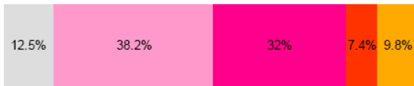
ACM lauko vaizdo ekranų pastebėjimo dažnumas per savaitę: respondentų segmentai (N=2229)

Tyrimo, atlikto 2006 m. kovo – gruodžio mėnesiais, Vilniaus, Kauno, Klaipėdos, Šiaulių ir Panevėžio miestuose, duomenimis, 11% visų apklaustųjų lauko vaizdo ekranus pamato beveik kasdien (5 kartus per savaitę), o 78% visų apklaustųjų lauko vaizdo ekraną pamato bent kartą, 12% - nepamato nei karto. 10% apklausos dalyvių negalėjo nurodyti, kelis kartus per savaitę pamato bent vieną ACM lauko vaizdo ekraną.